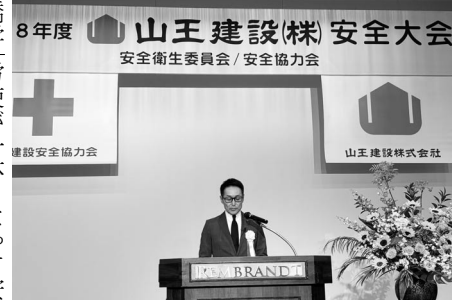
山王建設(株)安全大会

確認などの行為の繰り返しを厭わず、日々努めてほしい」と述べた。今年度の安全目標として、▽墜落災害防止、▽安全大会▽安全パトロール、などに取り組む。